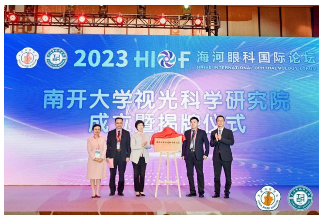
南开大学视光科学研究院成立

习部分包含眼科学及眼视光学相关学时，由天津市眼科医院（南开大学附属眼科医院）承担眼视光医学专业学生临床教学任务。相比临床医学专业，眼视光医学专业则更早锁定专业方向，在选择眼科学及眼视光学就业与深造时具有优势。