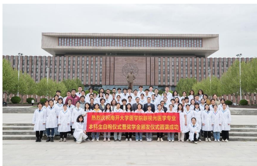
眼视光医学专业本科生白袍授予暨南开大学附属眼科医院奖学金颁发仪式