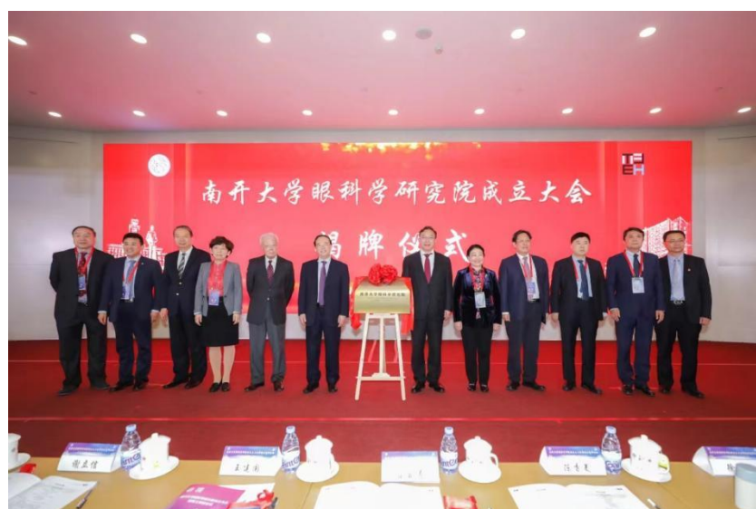
南开大学眼科学研究院成立