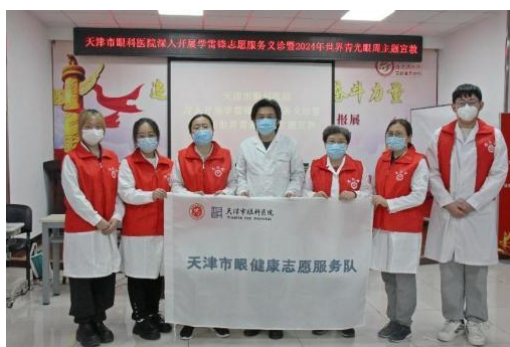
眼视光医学专业本科生参加志愿服务活动