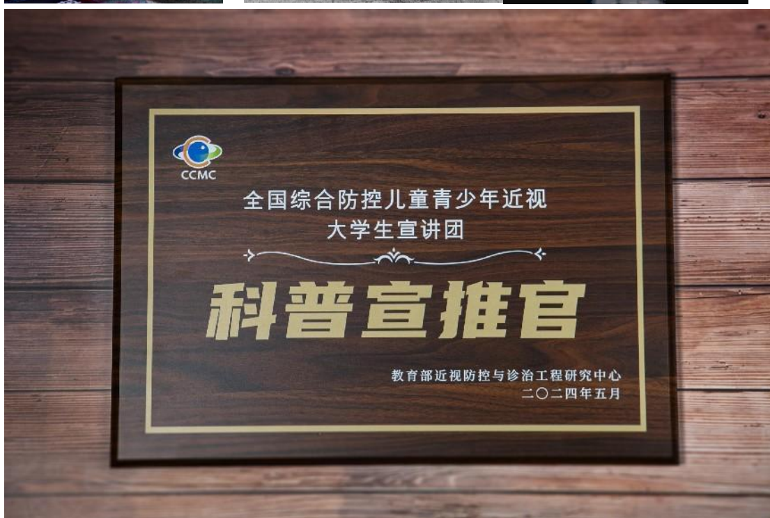
眼视光医学专业建设成果及部分学生获奖